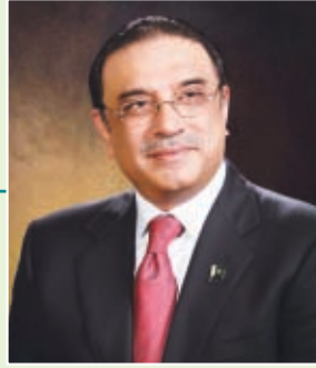
آصف علي زرداري

• طالبت الحكومة الفلبينية المعلمات المسلمات العاملات بالمدارس الحكومية بخلع النقاب أثناء التدريس بالفصول بزعم تحقيق تواصل أفضل بين المعلمات والطلاب، وللتغلب على ما قد يعرقل العملية التعليمية من وضوح الصوت والحروف وغير ذلك! وزعمت وزارة التعليم، أن القرار يأتي في إطار دعم العلاقة بين المعلمة والتلاميذ والتعرف عليها، ولا يتعارض مع حماية واحترام الحريات الدينية، وزعم المكتب الحكومي للشؤون الإسلامية أن القرار يتوافق مع رأي قطاع كبير من علماء المسلمين، وتأتي هذه الخطوة في أعقاب منع مدرسة كاثوليكية المسلمات من ارتداء الحجاب وتدخل المجلس الإسلامي والجمعيات الحقوقية للتأكيد على حق المسلمات في ممارسة دينهن. ■