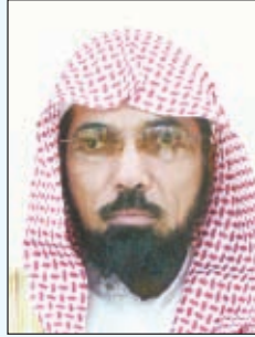
بقلم: د. سلمان بن فهد العودة (*)

تكون نافية لما يظن من المنع والتحريم. وقد يكون البيان تخصيصاً للعموم.