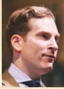
نوح فيلدمان (*)