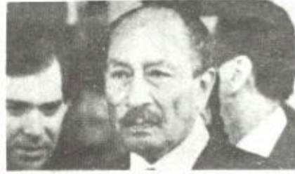
وايزمان خرد السادات