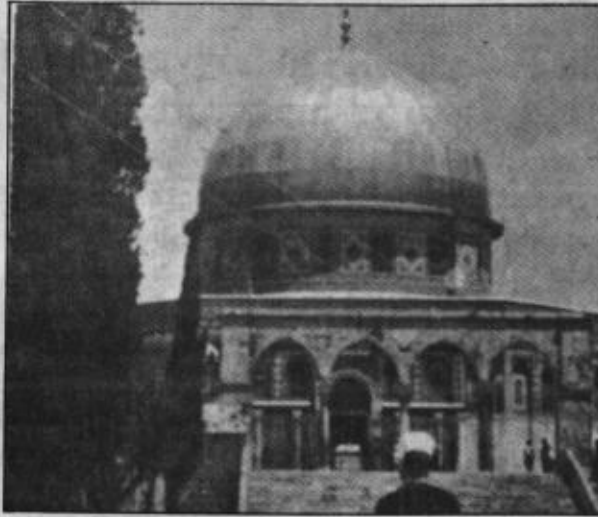
الاقصى .. رمز الحركة الاسلامية الفلسطينية