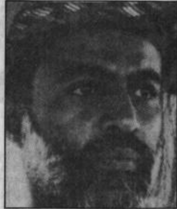
السلطان قابوس.. ومصير جزيرة مصيرة.

تنتهي إلى العالم الثالث بسياسة عدم الانحياز الفعلية. تلك التي «تعكس روحاً تضامنية قوية حتى لا تكون لقمة سائغة للغير».