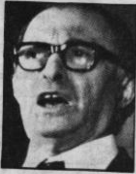
• بيغن .. وأمن اسرائيل الهش