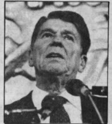
ريغان.. الاهتمام بالجانب العسكري والقواعد.

لقد طالبت مصر أمريكا زمن كارتر باستخدام الأراضي المصرية لإنشاء قواعد عسكرية لها.. وكذلك فعلت الصومال وسلطنة عمان ودول أخرى من المنطقة الإسلامية.. أما قذافي ليبيا فقد جعل من البلاد الليبية مقراً ومستقراً وقاعدة كبيرة للتحرك الروسي الشيوعي في قلب العالم الإسلامي وأفريقيا والبحر الأبيض المتوسط.. أما سورية التي ارتبطت بمعاهدة مع الروس فإنها لا تقبل في فعلتها عن فعلة القذافي في جلب القوى المتنافسة وتمركزها في قلب عالمنا المحصور بين