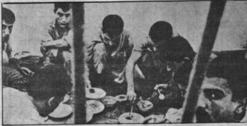
• المعتقلون الفلسطينيون في سجون اسرائيل

ورشاشات صغيرة من نوع عوزي ومعظمها من انتاج الجيش الاسرائيلي. وقد أبقى على عمليات كشف هذا التنظيم طي الكتمان وجرت جميع مناقشات اصدار اوامر التوقيف ضد أعضاء التنظيم بشكل سري.