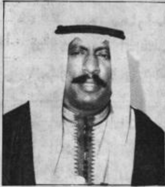
• ولي العهد: انتظروا البرنامج