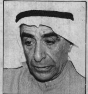
• جاسم الصقر: هاجس المواطنين

ابدى ذلك النائب جاسم الخرافي. اذ ان النواب وان كان مفروضا أنهم درسوا الخطاب الأميري وسجلوا ملاحظاتهم عليه، الا ان عدم وضعه على جدول الأعمال بشكل مستقل لم يفسح المجال لبعض النواب من المشاركة في ابداء الرأي والملاحظات حوله، كما أن الوقت المخصص عادة لبند مايستجد من اعمال لا يتسع لابداء آراء جميع النواب أو معظمهم. وهذه الملاحظة نسجلها لعلها تؤخذ بعين الاعتبار مستقبلا اذ ينبغي ان تكون للقضايا المهمة بنودا مستقلة على جدول الاعمال.