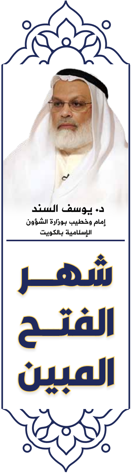
د. يوسف السند إمام وخطيب بوزارة الشؤون الإسلامية بالكويت