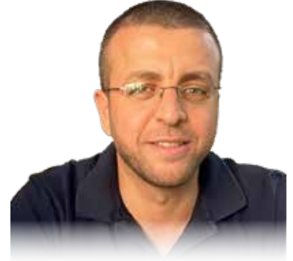
محمد القيق كاتب وصحفي فلسطيني

يعزز الرئيس الأمريكي دونالد ترمب من معادلاته الإستراتيجية في المنطقة بعدة زوايا، ولعل الأساس في ذلك كله هو «الشرق الأوسط الجديد» الذي تحدث عنه مراراً وتكراراً في خطابه ومؤتمراته حتى وفي خطبه، ونسقها جيداً مع رئيس الوزراء الإسرائيلي بنيامين نتنياهو.