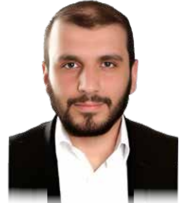
مصعب الناصر كاتب سوري

المؤسسات المدنية والعسكرية بشمال شرقي البلاد في إدارة الدولة وتأكيد وحدة أراضي البلاد وانسحاب قوات «قسد» من حلب إلى شرقي الفرات.