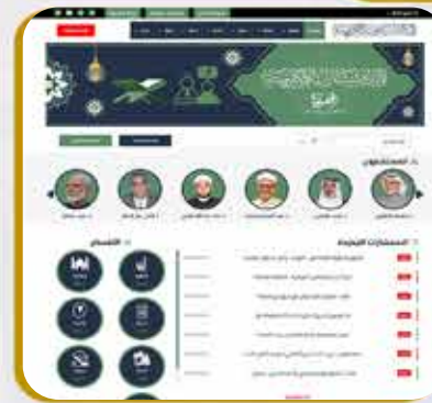
بوابة الإستشارات الإلكترونية