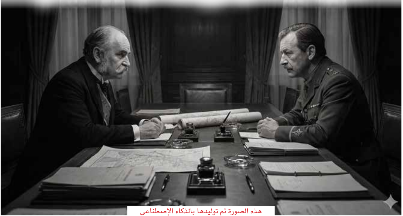
هذه الصورة تم توليدها بالذكاء الاصطناعي