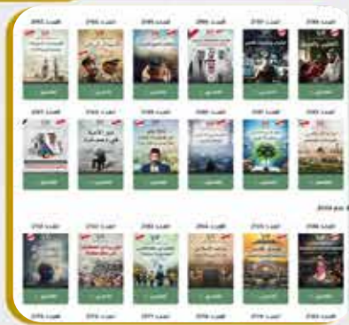
بوابة أرشيف المجتمع