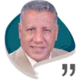
أ.د. حلمي القاعود أستاذ الأدب والنقد

شاع في الفترة الأخيرة استخدام مصطلح القيم الصلبة في مواجهة القيم السائلة، حيث ترتبط القيم عادة بالأخلاق والسلوك في المجتمع، والحكم على الفرد والجماعة من خلالهما، وقد تغيرت طبيعة المجتمعات العربية الخلقية والسلوكية في العقود الأخيرة لأسباب شتى، فتراجعت حضارياً وقيماً إلى الوراء في معظم المجالات الحياتية والإنسانية، بدلاً من التقدم إلى الأمام.